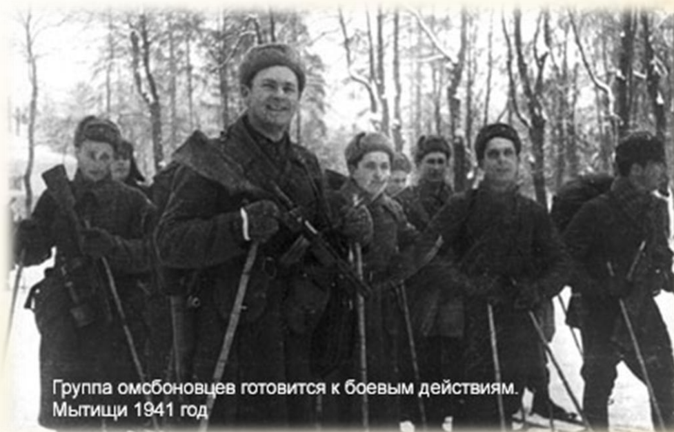
Группа омсбонцев готовится к боевым действиям. Мытищи 1941 год